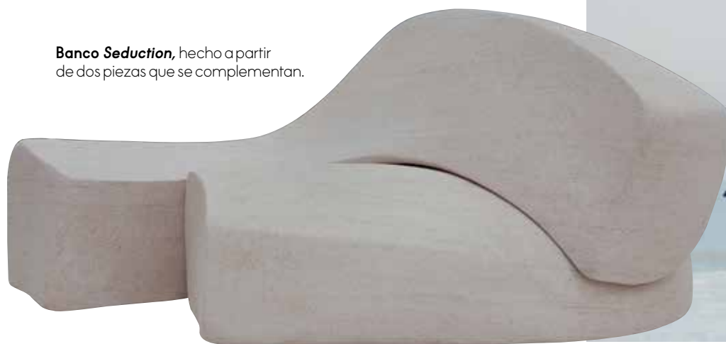
Banco Seduction , hecho a partir de dos piezas que se complementan.

Más cercana al arte que al diseño, en la manera en la que piensa sus piezas de una forma libre de los opresores fundamentos del diseño que obligan a dar respuesta a cuestiones prácticas. Najla El Zein está interesada en escudriñar la relación entre forma, uso y espacio de un modo nada ortodoxo y que rompe las barreras de aquello que pudiera separarla de la escultura. Sus expresivas piezas de sinuosos perfiles y extrañas formas obligan a repensar el objeto y nos hace plantearnos cuestiones básicas como si podemos tocarlas o usarlas como asientos. ¿Son sagradas o profanables? No hay respuesta acertada o equivocada, está en cada uno decidir y actuar en consecuencia. najlaelzein.com