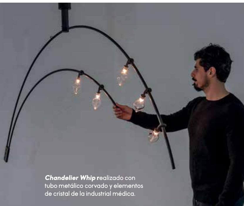
Chandelier Whip realizado con tubo metálico corvado y elementos de cristal de la industrial médica.