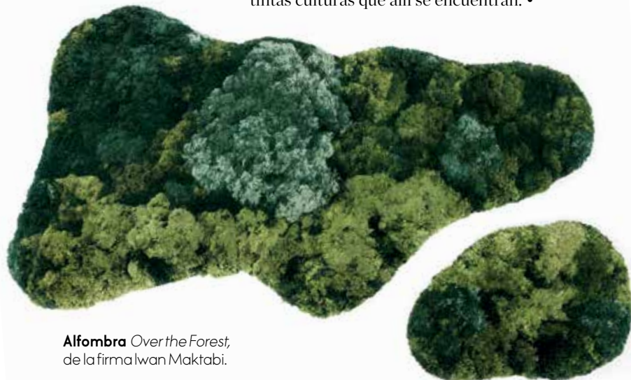
Alfombra Over the Forest , de la firma Iwan Maktabi.

Esta diseñadora ha probado muchos campos antes de centrarse en el diseño, después de estudiar en la Domus Academy de Milán. Sus primeros trabajos los produjo Edra pero su deriva siempre tuvo una vertiente artística y de experimentación, cuestionando ideas preconcebidas sobre el diseño contemporáneo. En Beirut abrió su estudio, en 2001, donde trabaja en estrecha colaboración con artesanos locales, para dar con piezas ambiguas que buscan provocar intriga y plantear cuestiones de uso y significado. Un trabajo a caballo entre diseño y escultura de definidas líneas geométricas con volúmenes rotundos. www.karenchekerdjian.com