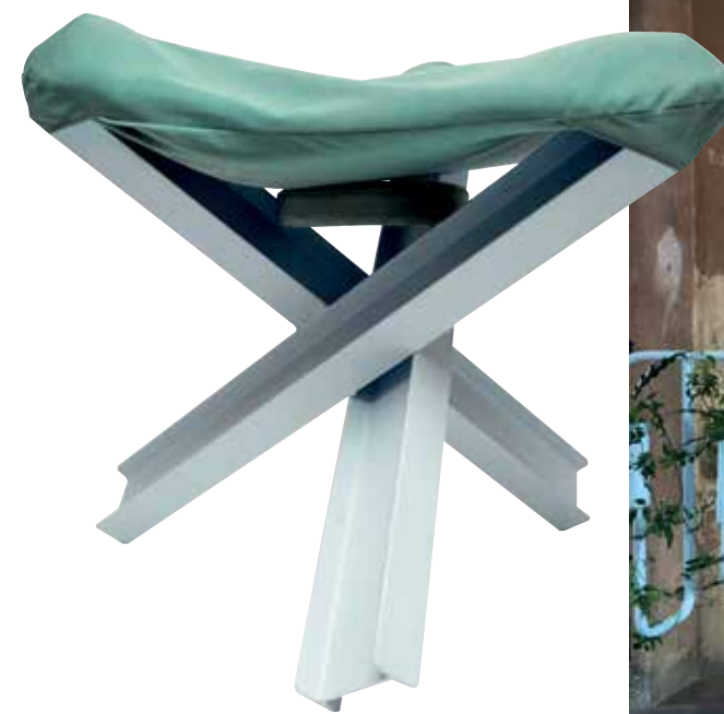
Taburete de la colección Holidays in the sun .