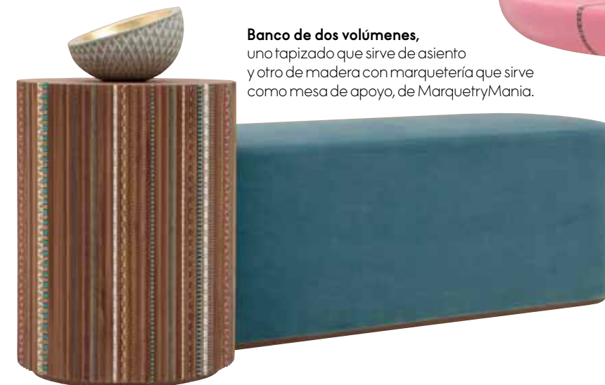
Banco de dos volúmenes , uno tapizado que sirve de asiento y otro de madera con marquetería que sirve como mesa de apoyo, de MarquetryMania.

Su estudio tiene gran éxito probablemente debido a la sabiduría con la que entiende al consumidor final y sabe ofrecerle un producto bien diseñado y mejor acabado, de un gusto contemporáneo, elegante y alegre, que sabe tocar la fibra sensible de su clientela. Ella misma es una mujer cosmopolita que ha recorrido el mundo y sabe reflejarlo en su trabajo, sin dejar de lado la influencia directa del Líbano. Conocedora del poder emocional que transmiten las cosas hechas a mano, en su práctica fomenta la asociación con talleres artesanales. Recientemente, por ejemplo, ha realizado una colección de piezas que se distinguen por el uso de la marquetería, realizada con precisión y buen hacer pero con un look muy personal. www.nadadebs.com