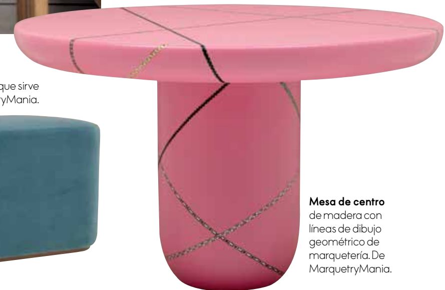
Mesa de centro de madera con líneas de dibujo geométrico de marquetería. De MarquetryMania.