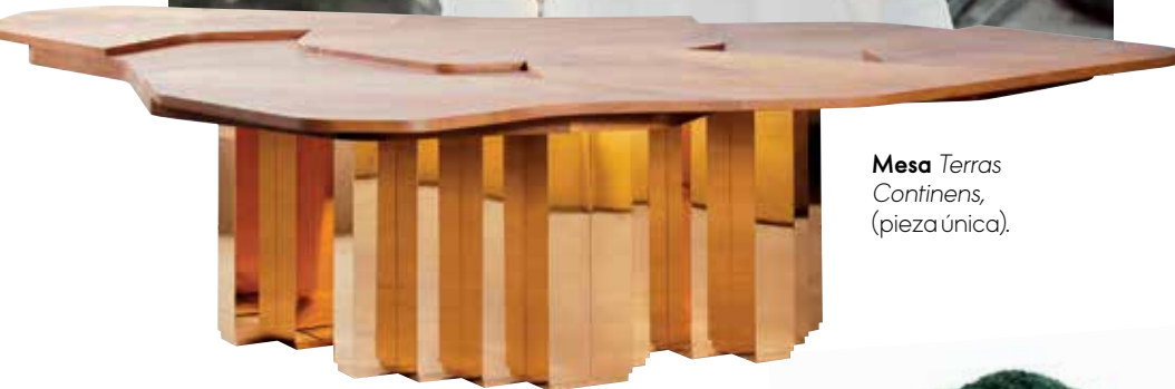
Mesa Terras Continens, (pieza única).