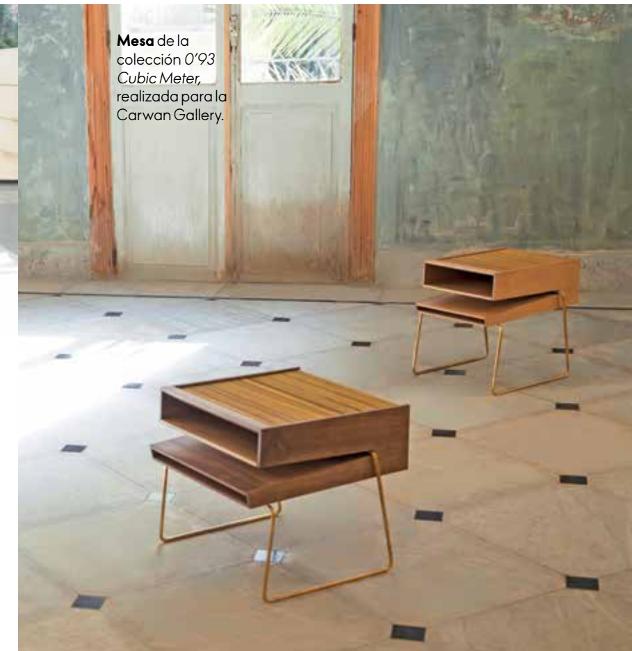
Mesa de la colección 0'93 Cubic Meter , realizada para la Carwan Gallery.

El estudio 200 grams lo fundan en 2013 Rana Haddad y Pascal Hachem preocupados por la posible desaparición del patrimonio artesanal del Líbano donde los talleres de producción local pudieran sucumbir a la invasión de producto barato industrial. 200 grams diseña colecciones de objetos que se producen a medida y que se adaptan a la manera de hacer de los talleres existentes. Su filosofía es la pequeña escala y los objetos irrepetibles, sencillos y funcionales para usuarios conscientes. Detrás de su trabajo hay mucho pensamiento e interés en enriquecer la ciudad en la que viven y lidiar con conceptos como elasticidad, tensión y equilibrio. 200grs.com