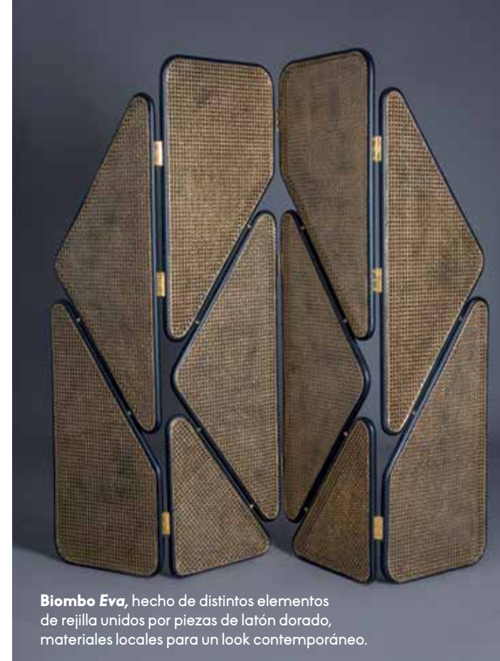
Biombo Eva , hecho de distintos elementos de rejilla unidos por piezas de latón dorado, materiales locales para un look contemporáneo.