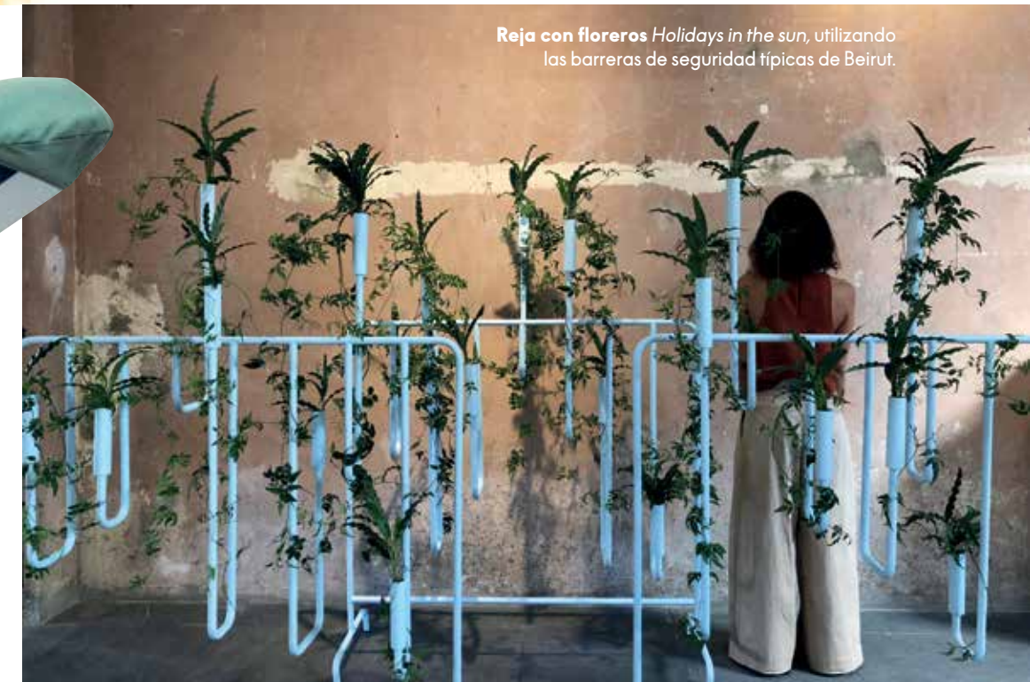
Reja con floreros Holidays in the sun , utilizando las barreras de seguridad típicas de Beirut.