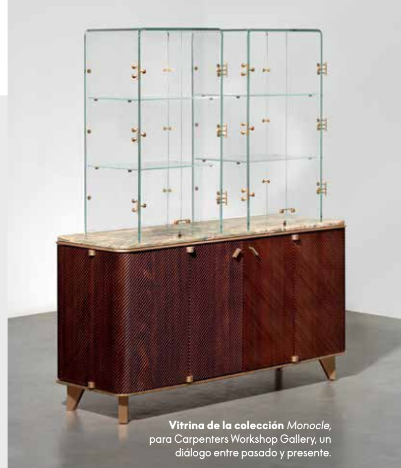
Vitrina de la colección Monocle , para Carpenters Workshop Gallery, un diálogo entre pasado y presente.