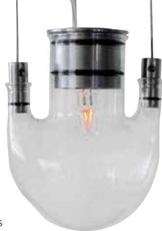
Elementos de cristal de Murano, de la colección Tasting Threads , realizada en Italia con tipologías libanesas.

Es arquitecto y desde que terminó sus estudios ha estado conectado a la zona industrial de Beirut, que él encuentra fascinante, a través de su empresa Fabraca Studios. Su intención es utilizar la sabiduría ancestral de los artesanos de la zona para dar salida a su espíritu creativo. Materiales nobles y técnicas sin edad para crear muebles y objetos que hablan de cultura local. Su última aventura ha sido una colección de lámparas. Debido a que en Líbano no hay mucha producción de cristal, usó su ingenio para arreglárselas y decidió reutilizar recipientes, pensados para ser de uso médico, convirtiéndolos en parte central de la iluminación de sus lámparas. La forma inusual de estas piezas de cristal le llevó a unir las entre sí por medio de varillas metálicas, dando lugar a estructuras que se adaptan en forma y tamaño dependiendo del lugar para el que están pensadas y que proyectan interesantes juegos de luces y sombras al iluminarse. www.fabracastudios.com