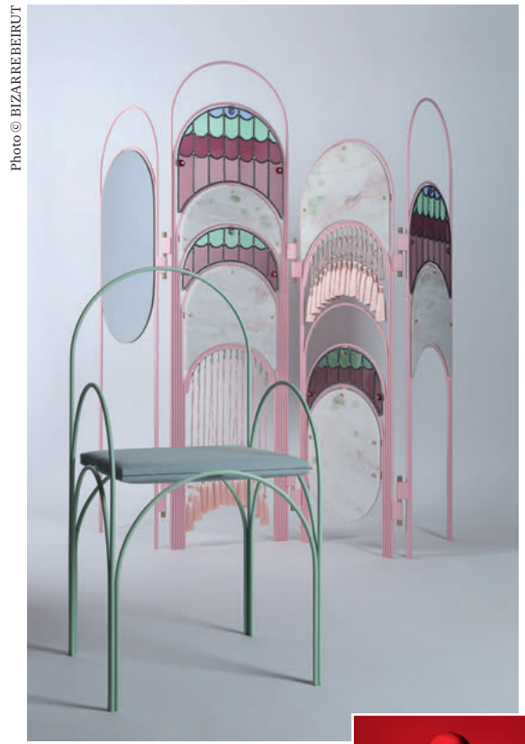
HAWA BEIRUT, 2018.