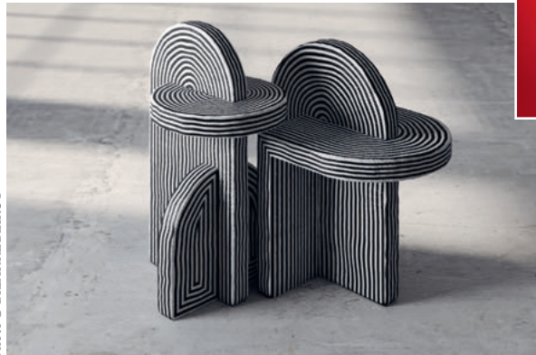
AFTER AGO, 2020.